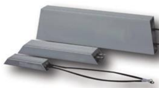
Резисторы ZC-BR-80W ... ZC-BR-1000W в алюминиевом корпусе

пар – параллельная схема, пос – последовательная схема, (пос)пар – комбинированная схема